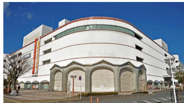
昨年9月に閉店したイトーヨーカドー。春には「NARA HEIJO PLAZA」へと生まれ変わる

ます。大宮通り沿いのまちづくりを一体的に進め、これを次世代へ紡いでいくため森田は、市に対して、県とより連携していくことを求めました。 また、そこから東に伸びる大宮通り沿いでは、昨年9月に閉店したイトーヨーカドーの跡を民間が再生に着手し、この春に「NARA HEIJO PLAZA」フロア計画参照として開業を迎える予定です。